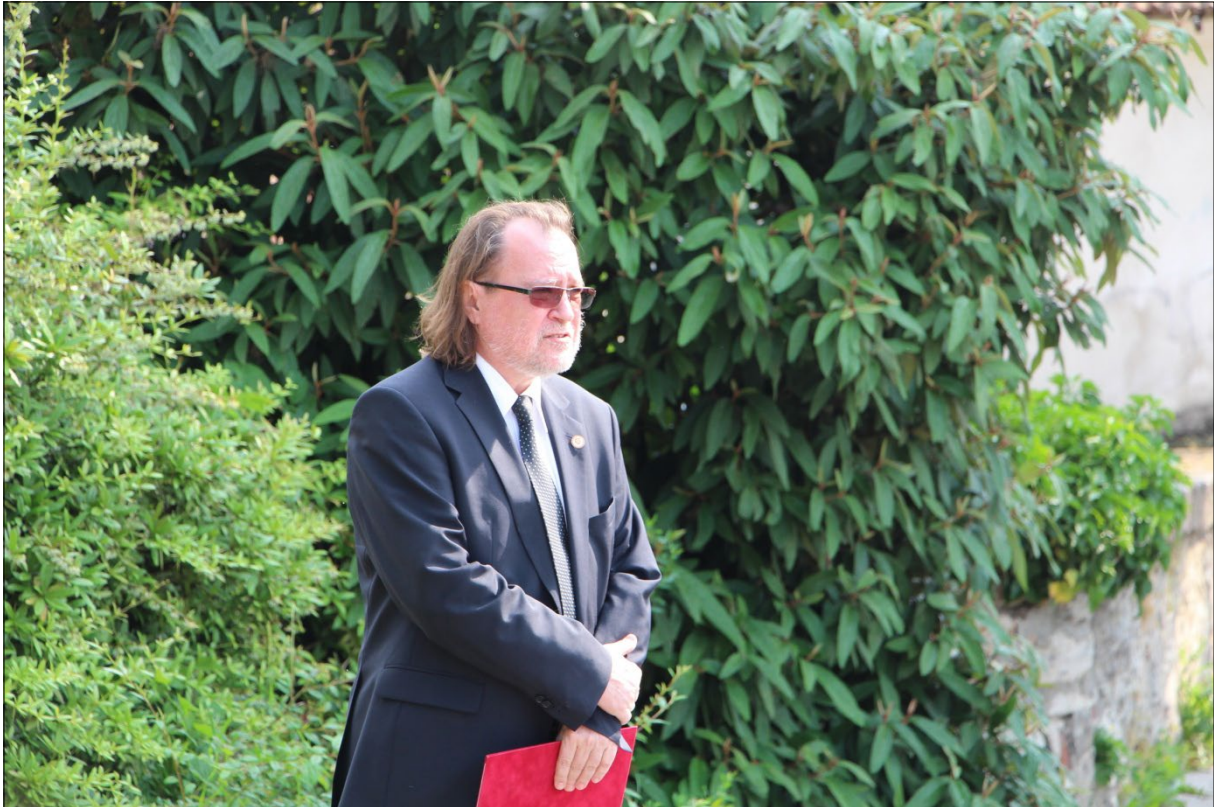
A Nemzeti Közszolgálati Egyetem Államtudományi és Közigazgatási Kar dékánjaként emlékezik Magyar Zoltánra tatai szobra előtt az Öreg-tó partján 2015-ben

Debrecenben született 1953-ban. A Nemzeti Közszolgálati Egyetem Közigazgatás-tudományi Karának és a Pécsi Tudományegyetem Állam- és Jogtudományi Karának egyetemi tanára. Szűkebb szakterülete a munkajog. Tudományos pályája során behatóan elemezte a munkajog alapintézményeit. Feltárta egyebek mellett a munkajogi konfliktusok jogi természetét, meghatározta feloldási módozataikat. A kutatás eredménye a kollektív érdekviták elismertetése a magyar munkajogban és feloldásuk törvényi szabályozásának kimunkálása. Vizsgálta a magánautonómia érvényesülését a munkajogban. Ennek eredménye a munkajog paternalista felfogásának cáfolata, annak bizonyítása, hogy a munkajog a magánjogi rend része. Feltárta a munkajog struktúráját, bizonyította az individuális és a kollektív munkajog korrelációját.