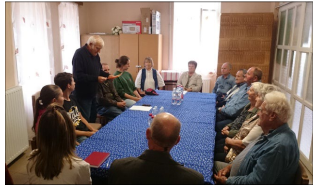
A tábor záróestje a helyi lakosokkal

Táborunk harmadik napja egybeesett a falunappal, s mi sem volt természetesebb, hogy részt vegyünk a rendezvényen. Főztünk is közösen, egy nagy bográcsban, lecsót, olyan kárpát-medenceit, népfőiskolást – mindenki hozzátett valamit.