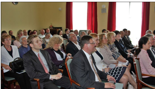
A városháza díszterme szűknek bizonyult