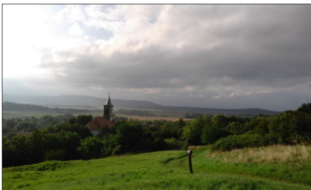
Kilátás a Kopasz-hegyről

A tábor hivatalos programja másnap kezdődött és meghatározott rendszer szerint folyt. Délelőttönként előadásokon vettünk részt, legelőször a falukutató táborok történetével ismerkedtünk meg, majd a Káli-medence társadalomtörténetéről, néprajzáról kaptunk adatokat, de a Balaton-felvidék népi építészetéről és a környék természeti értékeiről is érdekes előadásokat hallhattunk – neves szakemberek tolmácsolásában.