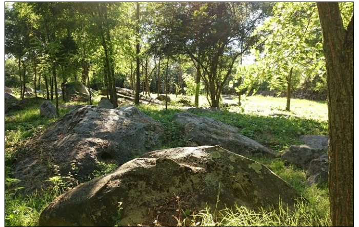
A „kőtenger” látványa

A generációk közötti együttműködést a felkeresett családokon keresztül vizsgáltuk, ahol az idősebbeket kérdeztük múltjukról, szokásaikról, és hogy ezekből mi hagyományozódott át a fiatalságra. Majd a következő napokon az eredmények kiértékelésével és elemzésével foglalatostoktunk.