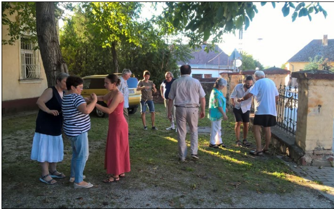
Ismerkedő feladat a népfőiskola udvarán

A tábor célja többretű volt, egyrészt minket, azaz a tábor résztvevőit, egy képzésben részesíteni, másrészt feltérképezni a generációk közötti együttműködést a megkérdezett családokon keresztül. Természetesen a feladatra közel sem elég egy hét, azonban a tervek szerint jövőre is folytatjuk illetve a helyi lakosok bevonásával év közben is dolgoznak tovább a helyi népfőiskolán.