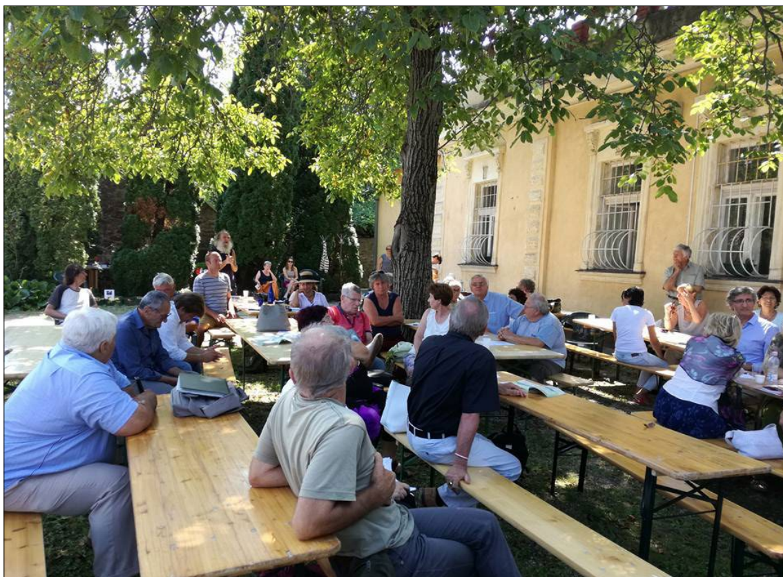
A kellemes idő is hozzájárult a jó hangulathoz Kövágóörsön

A népfőiskolának és tagságának meggyőződése, hogy a mai közélet megértése, feltárása vezethet ahhoz a felismeréshez, hogy csak belülről és alulról merítve lehet és tud a társadalom, a felelős állampolgár a jövő alakításában hatékonyan cselekedni, jövőt formálni. S hogy ezt a nemes célt érthetővé, sőt közérthetővé tegyék, két olyan közéleti embert sikerült megnyerni előadóként erre a találkozóra a népfőiskolának, akik tevékenységét mindazok figyelemmel kísérhették és kísérhetik a mai napig, akiket egy kicsit is érdekel a fenti témakör. Hiteles és mértékadó személyiségeket: Kukorelli István alkotmányjogász és Gémesi György , Gödöllő polgármestere, a Magyar Önkormányzatok Szövetségének elnöke személyében.