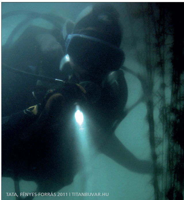
A kép az Interneten elérhető Búvárklub beszámolóban szerepel

Régi mondás: Nem akkor kell kutat fúrni, amikor az ember megszomjazik. Ne legyen igaz az ellenkezője: A forrásvizek medrét ne akkor ássuk, amikor csónakkal lehet benne közlekedni.