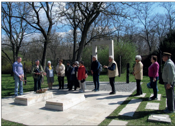
A népfőiskolai csoport koszorút helyez el a Névtelen hősök és Nagy Imre emlékhelyénél.

2017. március 30-án az 1956-os forradalom és szabadságharc 60. évfordulójára létrehozott Emlékbizottság támogatásával „Látóút”-at szervezett a szakmai vezetés Budapestre. Az autóbuzsós kirándulásunk első állomása a Rákoskeresztúri Újköztemető Nemzeti Emlék-hely Látogatóközpontja volt, a Nemzeti Örökség Intézete által működtet. A Népfőiskolai osztályfoglalkozásokon tanultakat felfrissítve, audiovizuális ismertetést kaptunk az '56-os forradalom és szabadságharc főbb eseményeiről, és az azt követő megtorlásokról, majd a Nemzeti Emlékhely 298-300-301-es nevezetes parcelláiról. Örömmel tapasztaltuk, hogy a 301-es parcellában nyugvók névsorát a Népfőiskolánkon is előadó tanárunk, Rainer M. János állította össze.