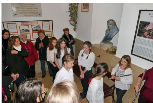
Vaszary megemlékezés az iskola előcsarnokában