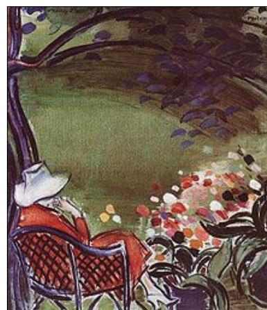
Nő kerti székben (1930 k.)

Egyetem docense a mester tanári működését, hatását a következő generációkra elemezte és illusztrálta az érdeklődőknek, köztük a helyi művészeknek is.