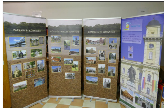
A tanácskozást helyi- és Felvidék értékeinek kiállítása is gazdagította