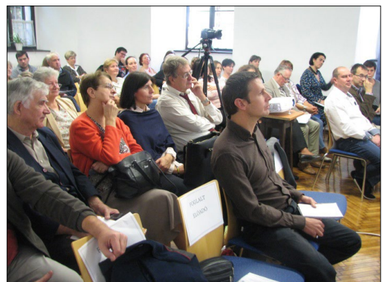
Műhely konferencia az iskolai közösségszolgálatról