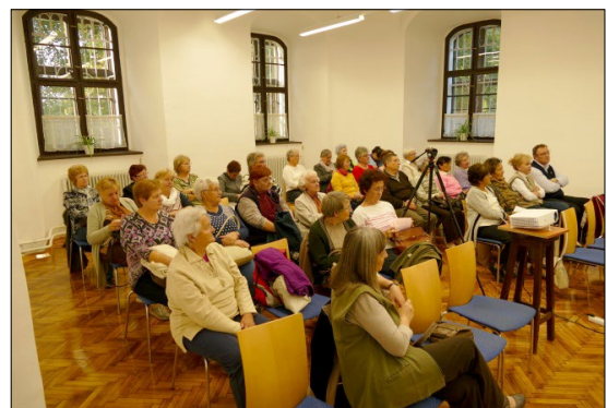
...és a közönsége