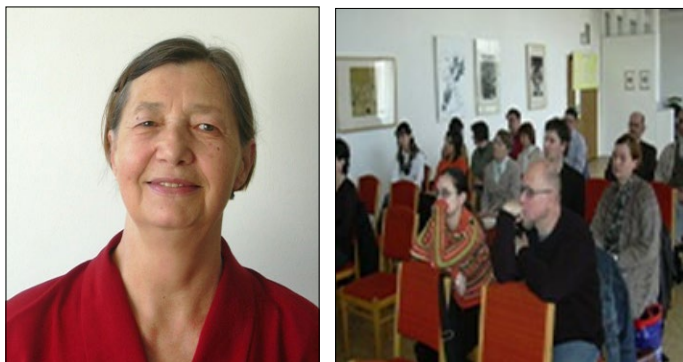
Egy 2006-os szakmai program résztvevője volt

Régi, kedves kollégától, az alapító tagok egyikétől búcsúzunk. Ő is azok közé tartozott, aki népművelőként dolgozott a tatai Megyei Művelődési Központban hosszú éveken át, később a Latex tatai gyárában igyekezett segíteni az ismeretek közvetítésében, az emberi kapcsolatok erősítésében. Szakmai szempontból is jelentős feladatot kapott a művelődési ház igazgatói feladatainak ellátásával. Később, titkárként részt vállalt a „KÉVE”, K-E Megyei Közösségfejlesztők Egyesülete tevékenységéből, de a Megyei Munkaügyi Központban is volt alkalmam együtt dolgozni vele. A szakmai tapasztalatok és ismeretek birtokában nem volt véletlen, hogy ő is azok közé tartozott, akik elsőként csatlakoztak 1995-ben a népfőiskola újraindításához. Aktív részese és segítője volt az első lépéseknek, az indulásnak. Sajnos betegsége már régóta kínozza, és ezért az utóbbi években nem tudott részt venni közösségünk életében. A betegsége kezdetén még reménykedtünk gyógyulásába, de sajnos, hamar kiderült, hogy nem javul helyzete, sőt egyre súlyosabb lett egészségi állapota, míg végül 2017 karácsonya előtt néhány nappal végleg elköszönt e földi léttől.