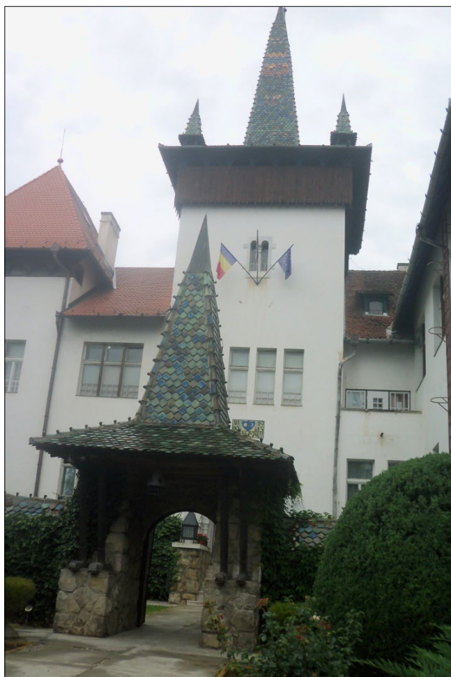
A Székely Nemzeti Múzeum épülete, Sepsiszentgyörgy