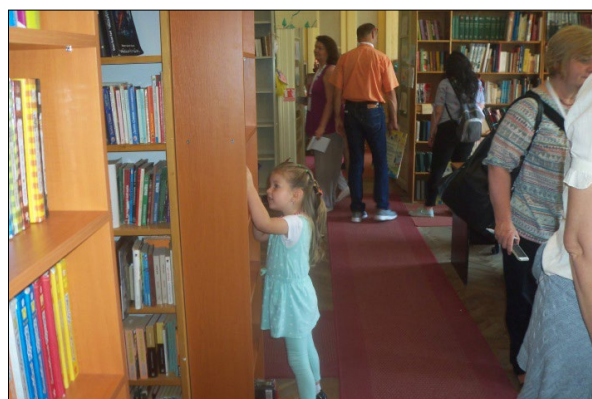
Egy ifjú olvasó a Bod Péter Megyei Könyvtárban.