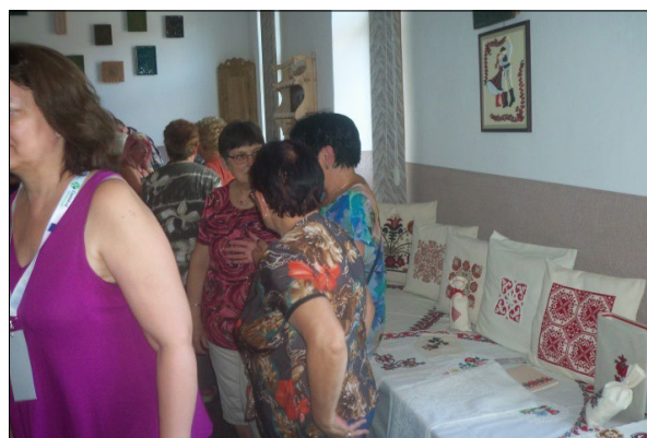
A Háromszéki Kézműves Egyesület kiállítása