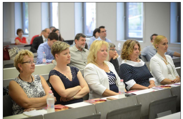
A K-E megyei résztvevők egy csoportja