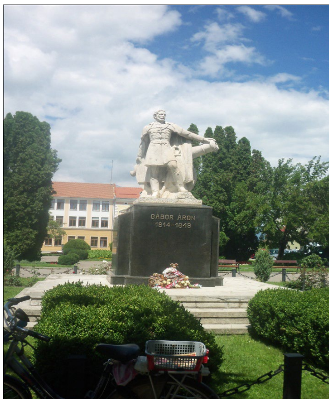
Gábor Áron szobra Sepsiszentgyörgyön