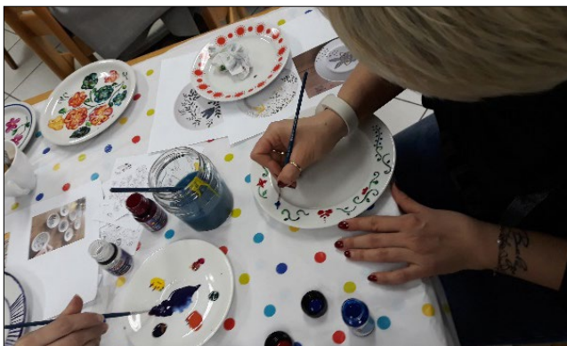
Színes virágok születése – ecsettel

Esélyegyenlőségi műhely: Hazai és határon túli népitáncos csoportvezetők beszélgetnek a közösségépítés és családsegítés módjairól