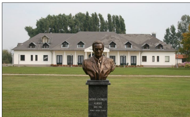
Szent-Györgyi Albert szobra a Lakiteleki Népfőiskolán

Ilyen közösségfejlesztő szerepet töltenek be az egyre nagyobb számban lévő népfőiskolák.