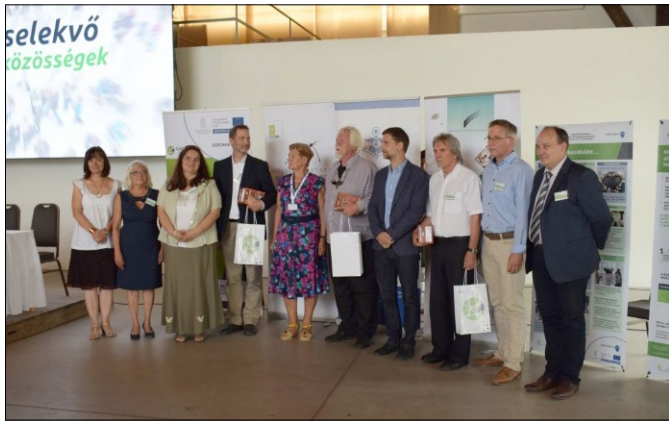
A program szakmai vezetői és a közösségfejlesztés elindításában aktív néhány kolléga

fogása egyebek mellett hozzájárult a valós közösségi értékek bemutatásához, a helyi közösségek megerősítéséhez, a helyi kulturális intézmények és az ott lakók közötti kapcsolatok erősítéséhez, illetve számos más területen is pozitív hatást fejtett ki.