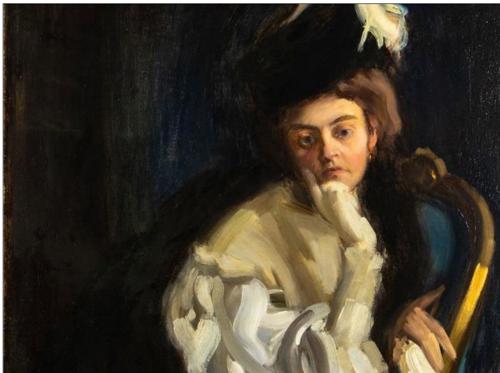
Vaszary János: Vaszary Mária, „Mimi”, olaj, vászon, 100 x 80 cm, a Gray’s Auctioneers jóvoltából

Itthon élt magyar festő külföldi árverésen szereplő műve ritkán kap akkora publicitást a nemzetközi szaksajtóban, mint a Vaszary János örökösaitől most az Államokban aukcióra kerülő festmény.