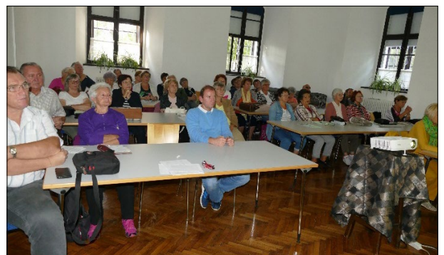
A Rákóczi sorozat első előadását nagy érdeklődés kísérte.